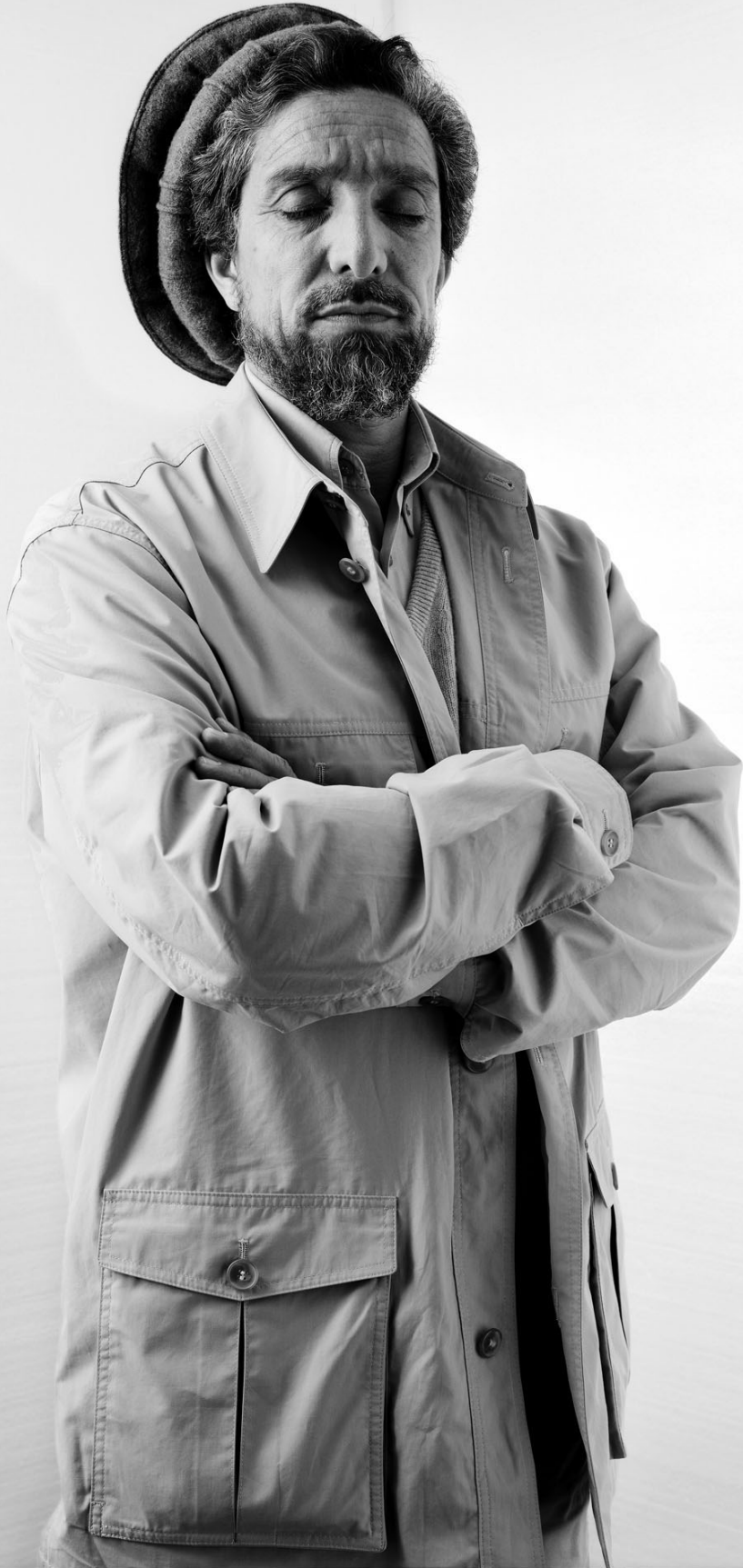
AHMAD SHAH MASSUD